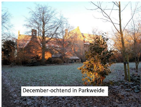
December-ochtend in Parkweide

Ditmaal een kroniek over een wat langere periode. Er zijn rondom de abdij en de abdijtuin dit najaar vele activiteiten geweest. Over de Open Tuindag van 10 september heb ik een aparte kroniek gemaakt en ook over de Landelijke Natuurwerkdag van 5 november. De Open Tuindag was erg succesvol, veel bezoekers, mooi weer en gezellige kraampjes. We hadden drukbezochte workshops "Appelazijn maken" en "Snoeischaar slijpen". Uit de opbrengst van onze verkopen hebben we kleine Euonymus-struikjes gekocht die tijdens de Landelijke Natuurwerkdag in de PAX-tuin zijn geplant. Tijdens die natuurwerkdag hebben we ook "de Beek" uitgebaggerd, de moestuin opgeknapt en de bostuin opgeschoond. Ook dat was weer een heel