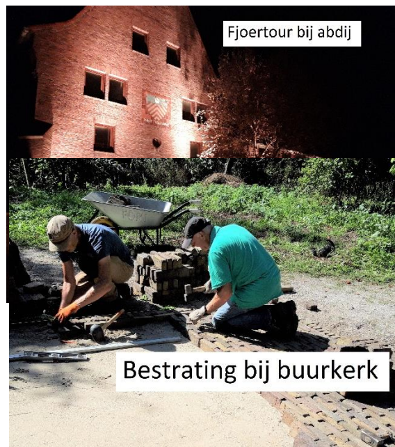
Fjoertour bij abdij

Buurkerk en kerkhof: Hier hebben we dit najaar o.a. schelpenpaden aangevuld en enkele verhardingen aangelegd, maar eerst even flink gerooid om "licht en ruimte" te scheppen. Voor 2023 staan daar ook weer enkele projecten op stapel.