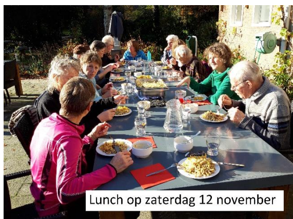
Lunch op zaterdag 12 november

en natuurlijk hebben jullie ook weer op de maandelijkse zaterdagen "de handen uit de mouwen gestoken: op 9 juli, tijdens de Open Tuindag van 10 september, 8 oktober, 12 november en 10 december. Op 13 augustus was het "bloedheet" en hebben we maar met een paar mensen (in de schaduw) gewerkt. Door de abdij worden we elke dag weer bedankt met een goede lunch. Zelfs in november nog in de volle zon.