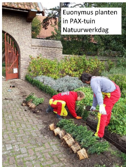
Euonymus planten in PAX-tuin Natuurwerkdag

geslaagde dag, waar we na de vele voorbereidingen met tevredenheid op terugkijken.