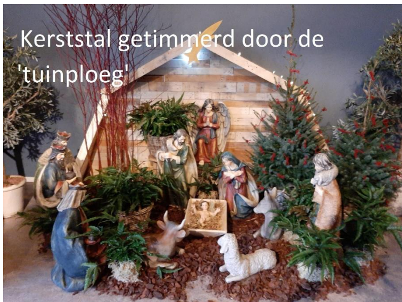
Kerststal getimmerd door de 'tuintploeg'