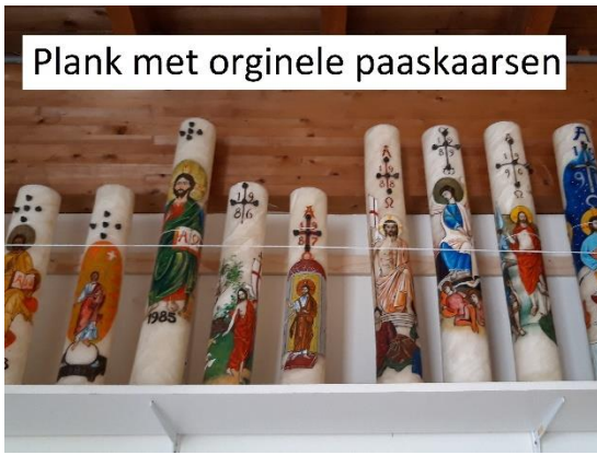
Plank met originele paaskaarsen

Technische klussen: Een aantal vrijwilligers van de tuingroep doen ook steeds meer "technische klussen". Zo weten ze in de abdijwinkel ons te vinden om een kastje te timmeren, de plank met de paaskaarsen te versterken, een rekje hier of daar te maken. In en aan de abdij een dakgoot te repareren, de lekkage in de regenwaterafvoer bij de Sacristie van de abdijkerk op te lossen, een waterkraan onder de abdijskeuken te vervangen. Binnenkort wordt de Kapittelzaal (weer) omgebouwd tot kapel, hetgeen veel energie zal besparen. Voor de retraitegasten is het wandelpaadje opnieuw betegeld en is er extra straatverlichting aangelegd achter het abdijgebouw. De houten wanden van onze eigen gereedschapsschuur waren bij de ramen